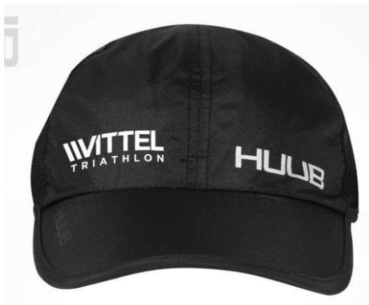
Casquette running Huub