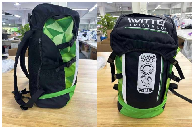
Sac à dos type Ironman aux couleurs VT