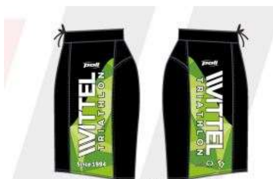
côté gauche côté droit